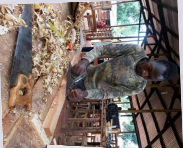
Uganda - PEFO