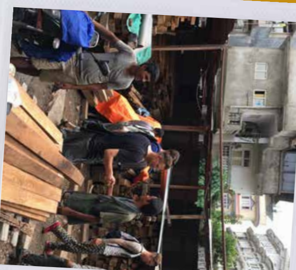
Nepal Sindupaldok 1