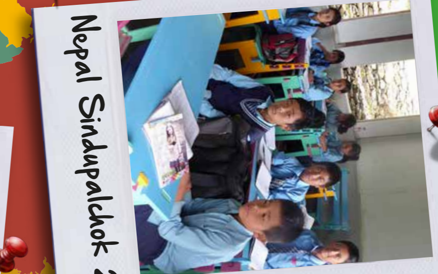
Nepal Sindupaldok 2